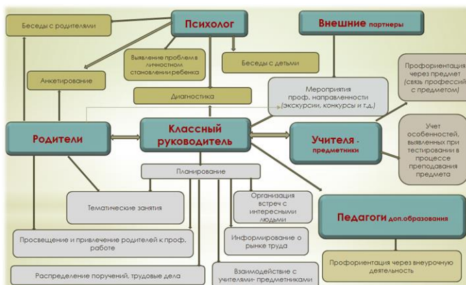
Схема взаимодействия участников профориентационной деятельности в МАОУ СОШ №54:

ВАРИАТИВНЫЕ модули: «Добровольческая деятельность», «Школьный музей», «Школьный спортивный клуб».