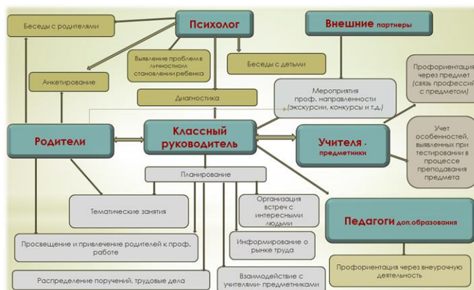
Схема взаимодействия участников профориентационной деятельности в МАОУ СОШ №54:

ВАРИАТИВНЫЕ модули: «Добровольческая деятельность», «Школьный музей», «Школьный спортивный клуб».