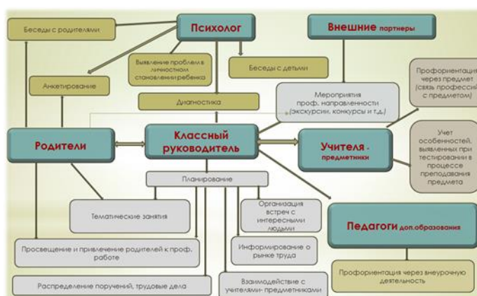
Схема взаимодействия участников профориентационной деятельности в МАОУ СОШ №54:

ВАРИАТИВНЫЕ модули: «Добровольческая деятельность», «Школьный музей», «Школьный спортивный клуб».