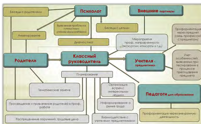
Схема взаимодействия участников профориентационной деятельности в МАОУ СОШ №54: