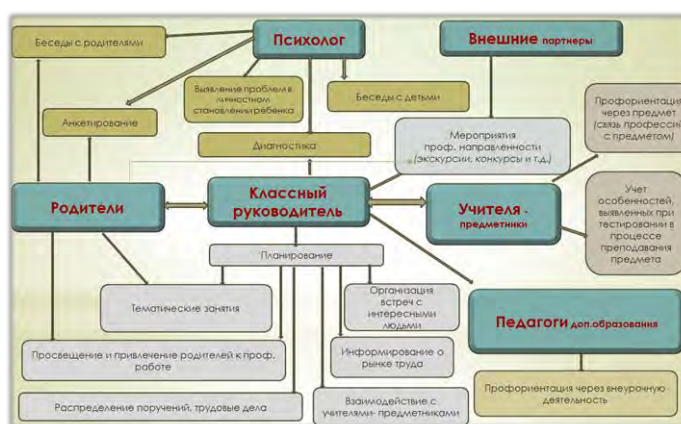
Схема взаимодействия участников профориентационной деятельности в МАОУ СОШ №54: