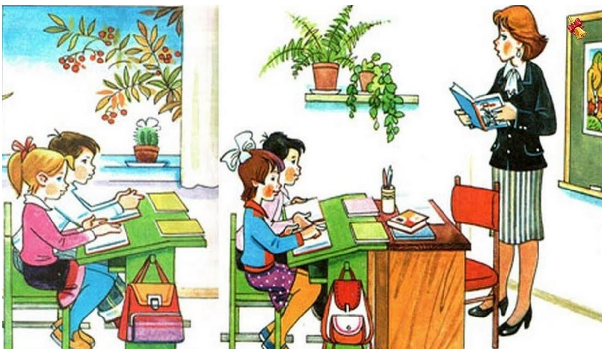
Рис. 1 На уроке